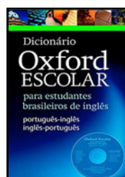
INGLÊS Dicionário Oxford Escolar Para Estudantes Brasileiros de Inglês A. S. Hornby

Os livros paradidáticos de Literatura e Inglês serão indicados no decorrer do 1º trimestre do ano letivo.